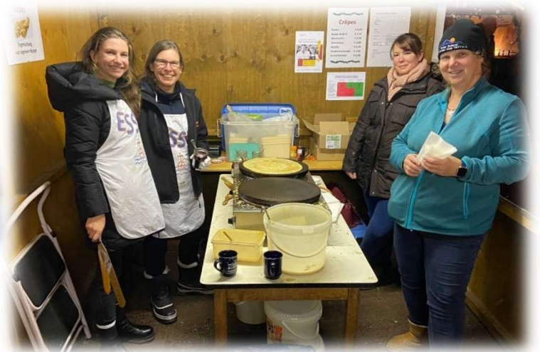
Weihnachtsmarkt im Alten Kurpark